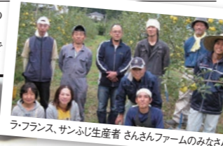
ラ・フランス、サンふじ生産者さんさんファームのみなさん

南アルプスと中央アルプスに囲まれた天龍川の流域にさんさんファームの果樹園があります。有畜複合農業で農薬を減らし、有機肥料のみで大切に育てた洋梨をお届けします。