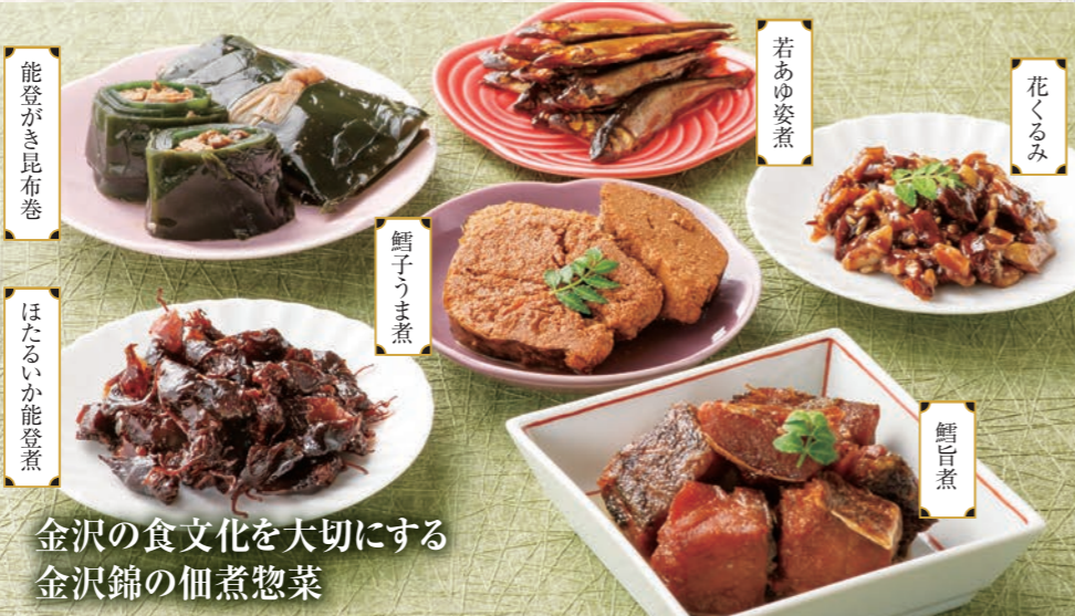
金沢の食文化を大切に 金沢錦の佃煮惣菜